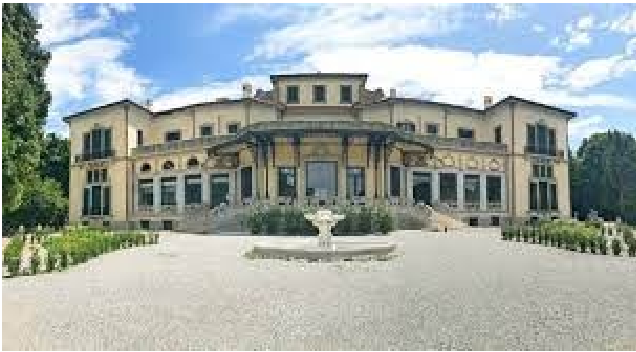
Tavola INCENDIO DI INTERFACCIA